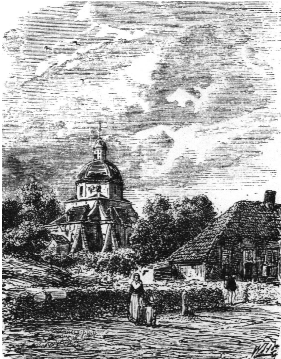
De Koepelkerk. Uit Nederlands Magazijn 1861.